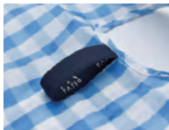
たたむ時のゴムバンド付き。