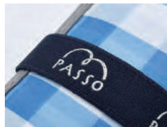
ゴムバンドにはシルバーのロゴマーク。