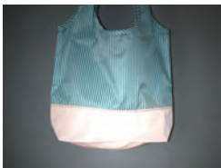
全て下側の生地がリフレクターになっています。

「おしゃれに安心できるショッピング」をコンセプトにした、PASSO エコバッグ。下部分をリフレクター素材にしたことで、暗い夜道を歩いても光で反射するように仕上げました。たたむと、名刺と同じくらいコンパクトに収納できます。