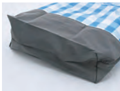
マチ付きで、見た目よりも大容量。