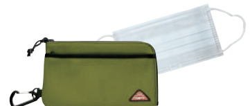
KHAKI (KH) JAN: 4516344094149